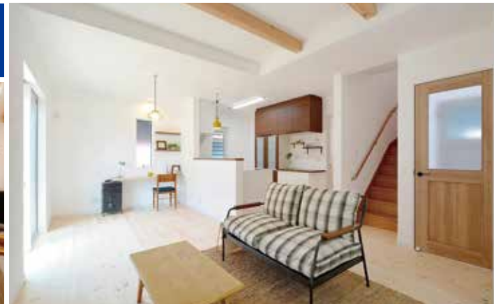
※インテリア写真は当社施工例になります。