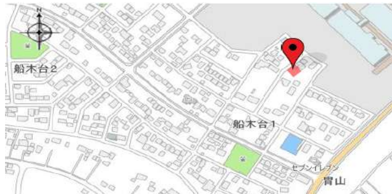
■図面と現況が相違する場合は現況優先とさせていただきます。 ■<仲介>ご成約の際には、当社規定の仲介手数料とそれにかかる消費税を別途申し受けます。